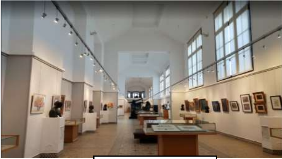
صورة لقاعة عرض الطابق